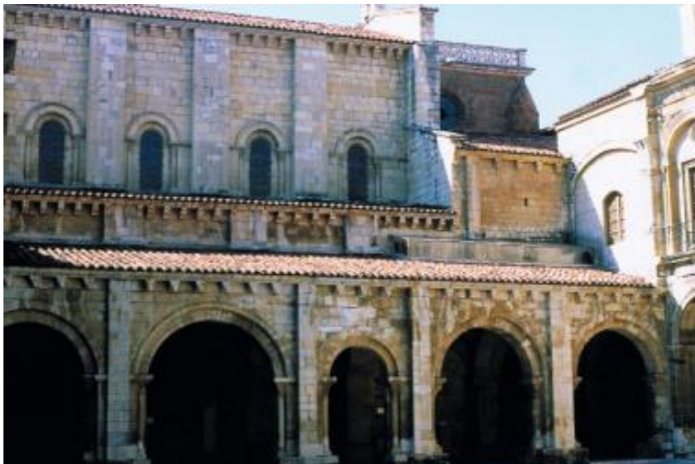
Fig. 3 : Pórtico norte, San Isidoro, ca. 1090