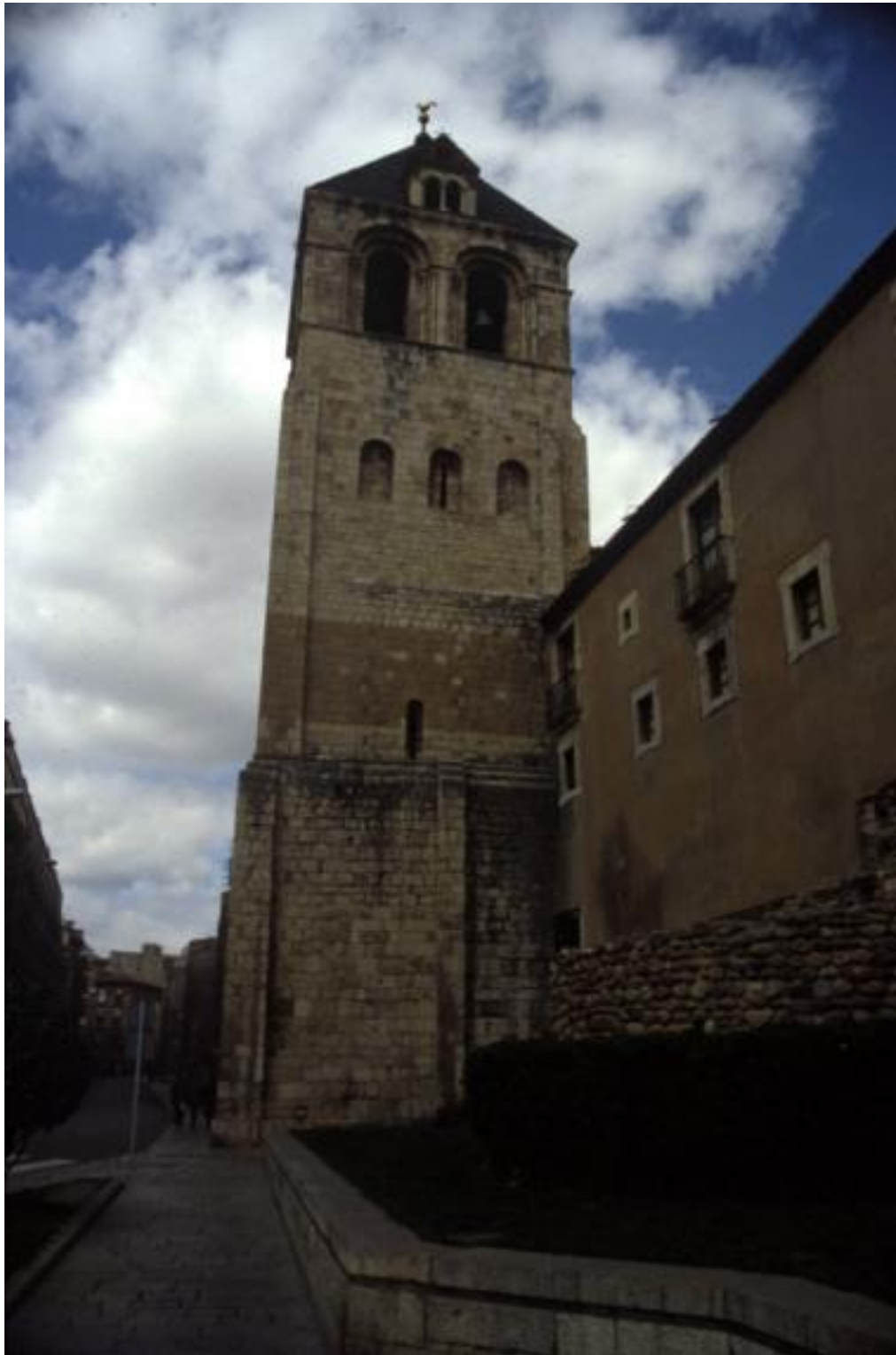
Fig. 5 : Torre, San Isidoro, ca. 1080-1150