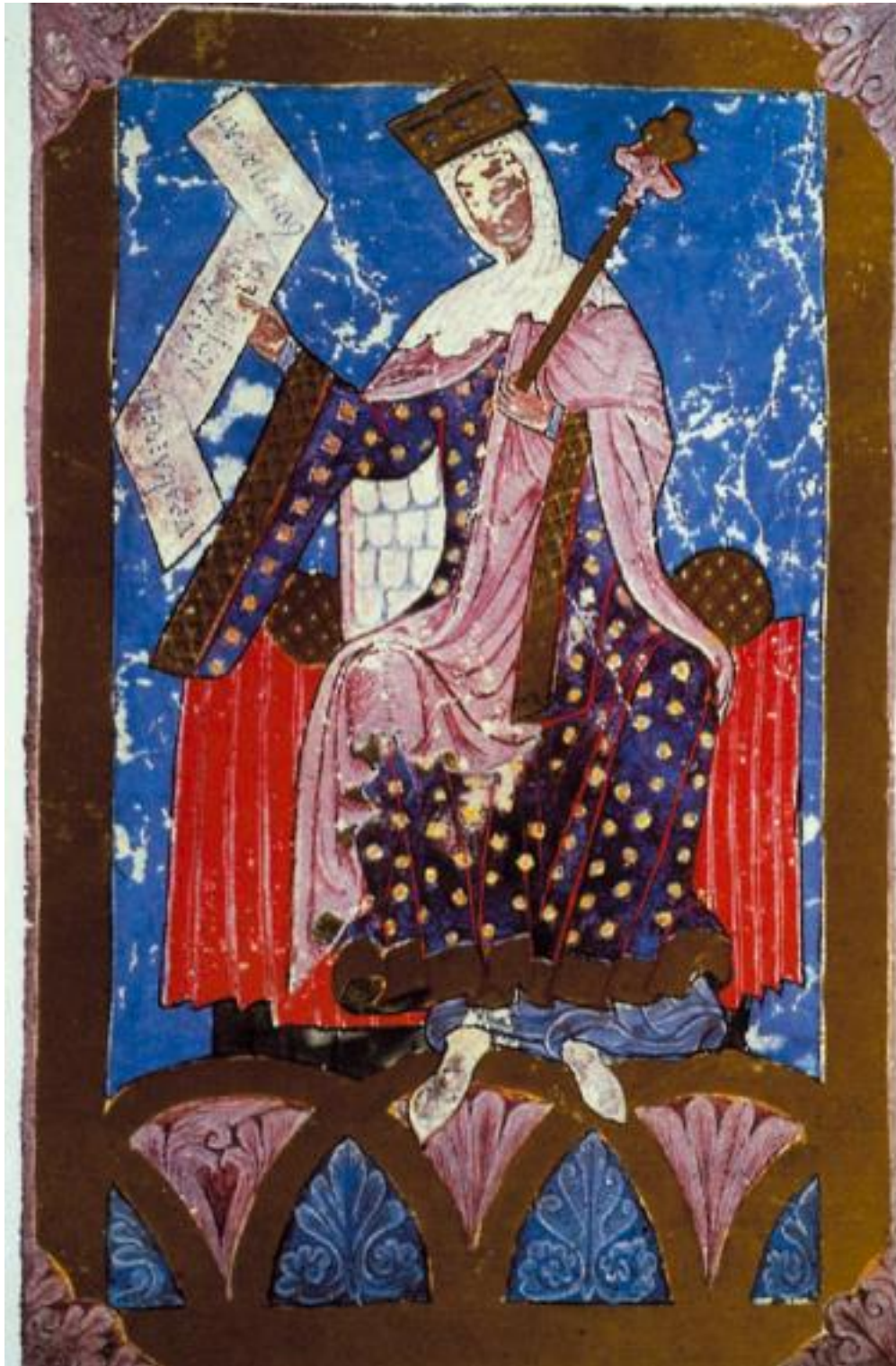
Fig. 6 : Reina Urraca, r. 1109-1126

Tumbo A, Archivo de la Catedral de Santiago de Compostela