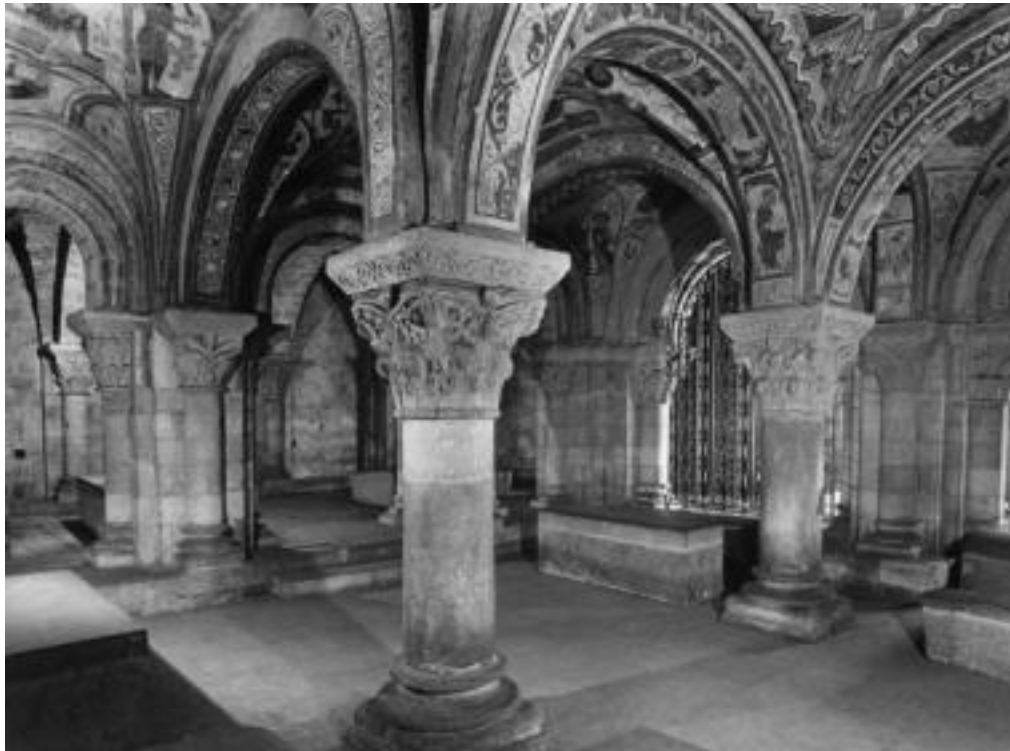
Fig. 2 : Panteón de San Isidoro, ca. 1080