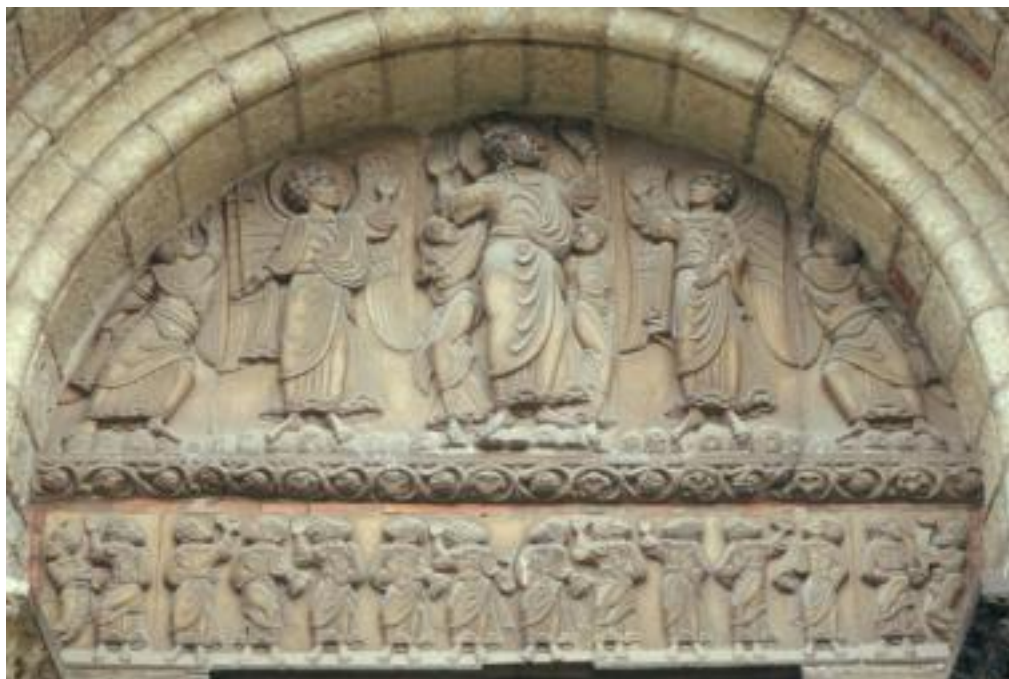
Fig. 9 : Tímpano de la Porte Miègeville, Saint-Sernin de Toulouse, ca. 1100