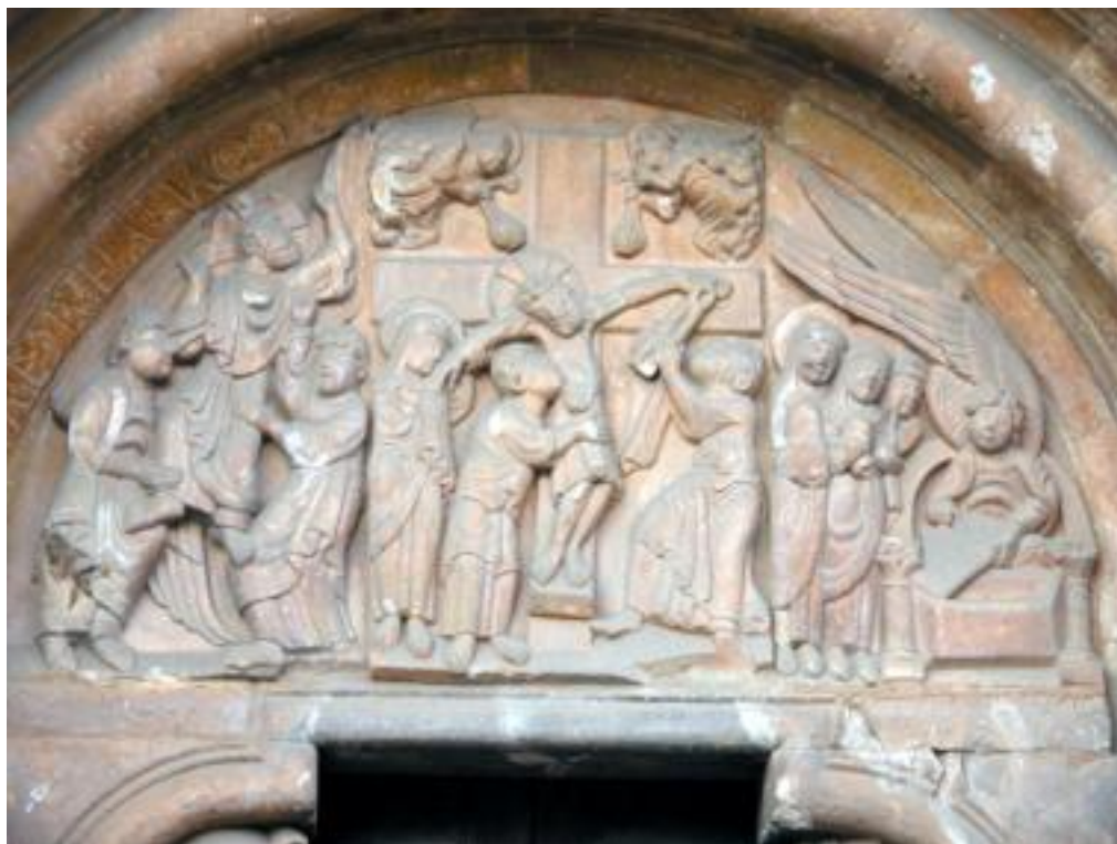
Fig. 8 : Tímpano del transepto sur, San Isidoro, ca. 1115