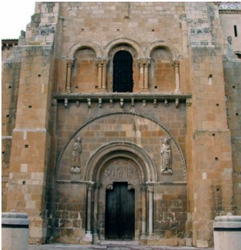
Fig. 7 : Portada del transepto sur, San Isidoro, ca. 1115