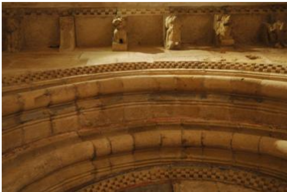
Fig. 11 : Modillones, portada del transepto norte, San Isidoro, ca. 1115