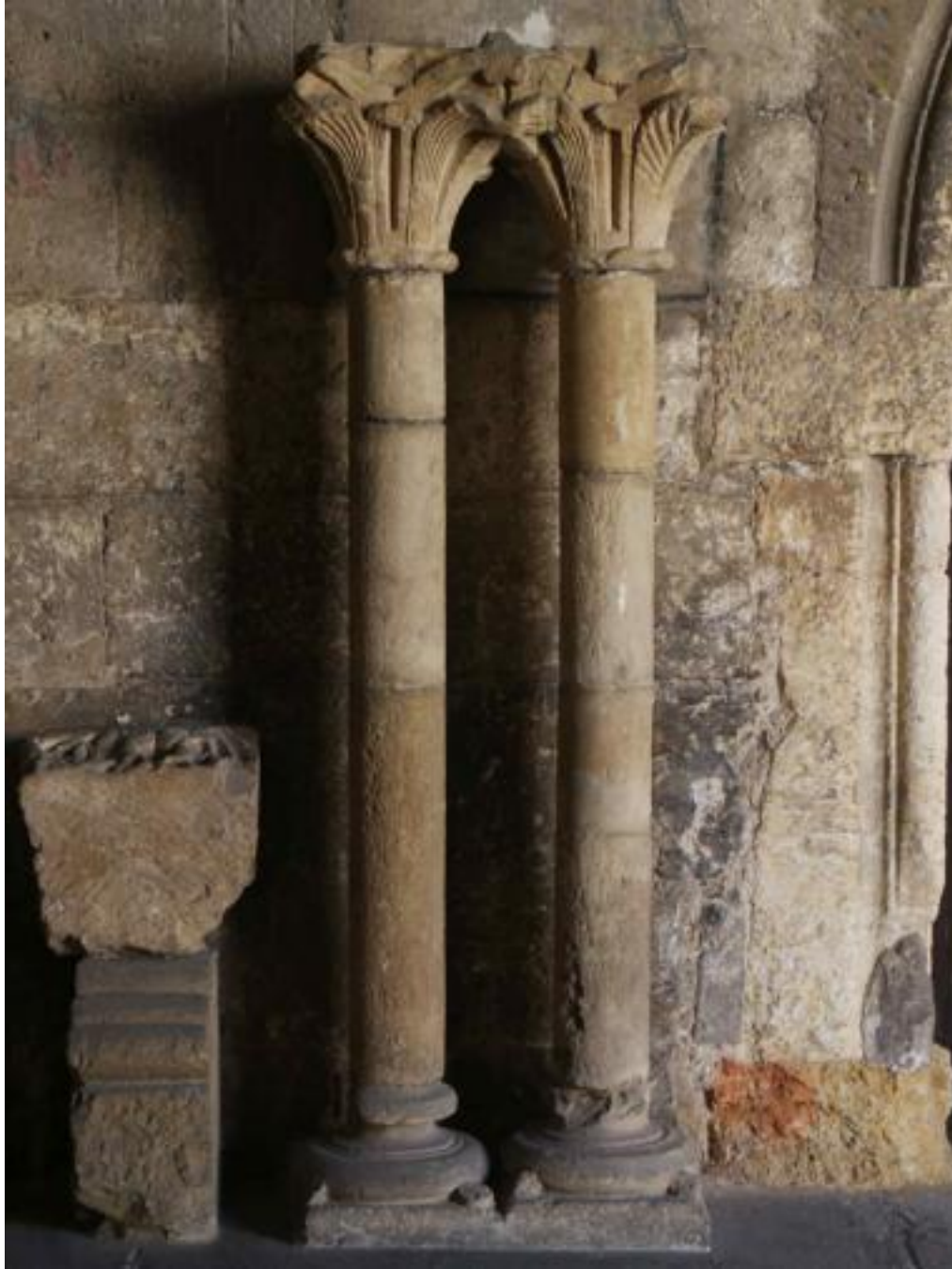
Fig. 10 : Capiteles del claustro, San Isidoro, ca. 1150